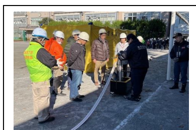
スタンドパイプ設置訓練